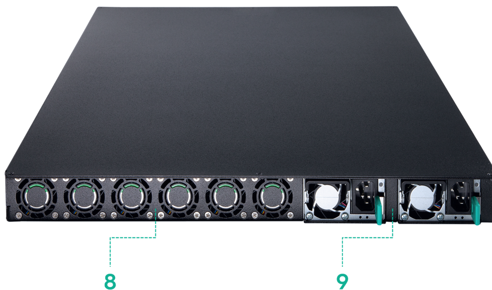
Рисунок 1.2. Задняя панель изделия

Функциональные элементы, расположенные на задней панели изделия представлены на рисунке 1.2.